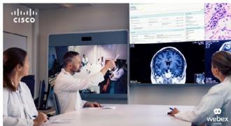
Gemeinsam behandeln: Tumorboard

Cisco sorgt mit seiner Plattform dafür, dass Tumorboard-Konferenzen hybrid stattfinden können – Ärzte im selben Raum, in unterschiedlichen