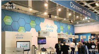
Telemedizin: Der Weg in die Zukunft

Mit „Connect and care“ hat Cisco eine Telemedizin-Plattform etabliert, die Patienten, Kliniken und Spezialisten für eine bessere Zusammenarbeit und Versorgung verbindet. Konkrete Anwendungsfälle hat Cisco auf der DMEA im April vorgestellt – Mehr dazu erfahren Sie im Mai in einem Online-Event und live auf dem Hauptstadt-Kongress in Berlin.