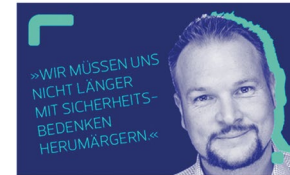
Text: Peter Schmitt, Illustration: Peter Schmitt/Herber

Special Newsletter in Kooperation mit der Bundesdruckerei